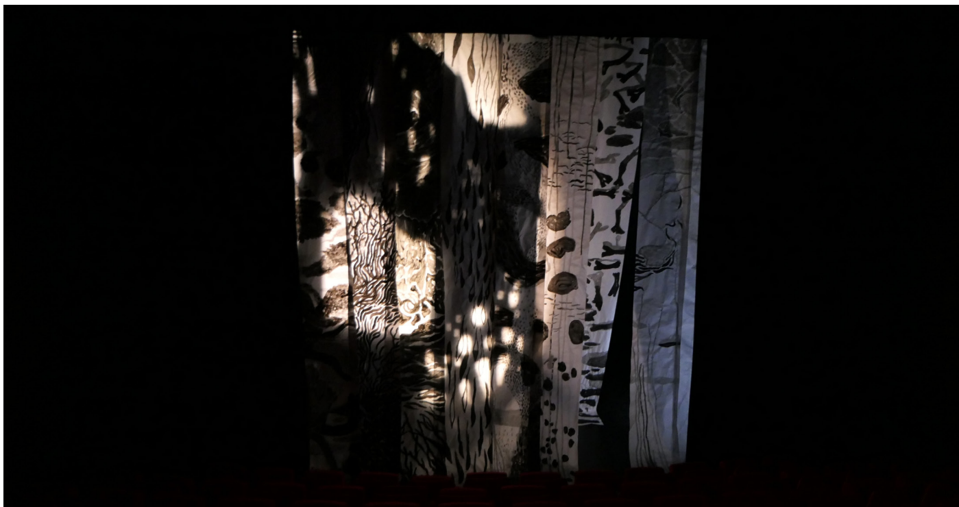
«L'entre-sort à Tentacules»