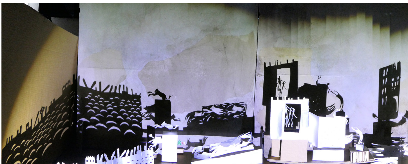
«L'entre-sort à Poils»

Il nous paraît intéressant d'avoir ce temps d'appropriation du lieu, pendant lequel le public voit un univers se construire, mais aussi de pouvoir y rester en représentation, habiter cet espace plusieurs jours d'affilé, le temps nécessaire pour que chaque personne apprivoise cette intrusion et puisse goûter à Suchet si elle le désire.