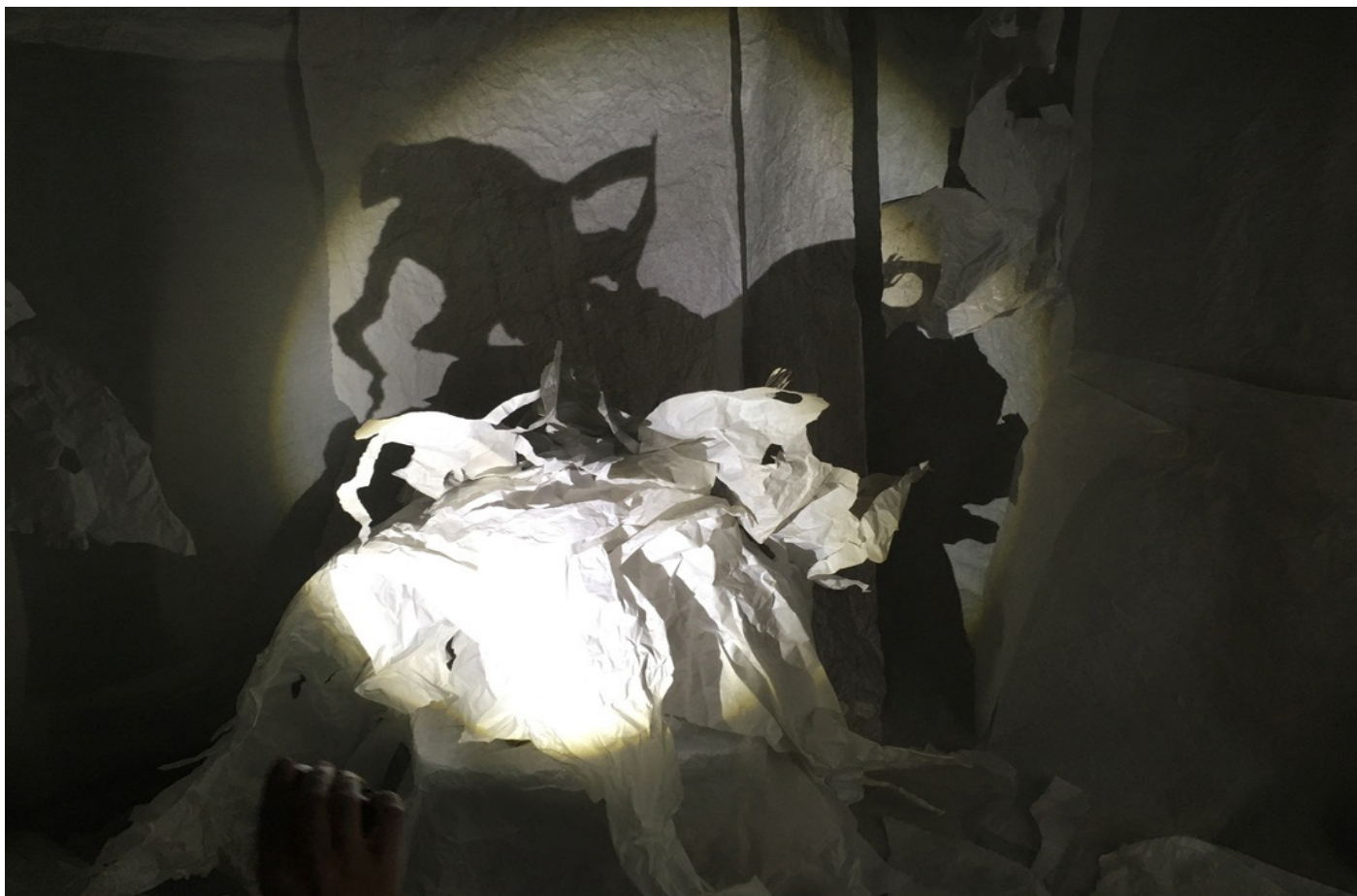
«L'entre-sort à Pieds»